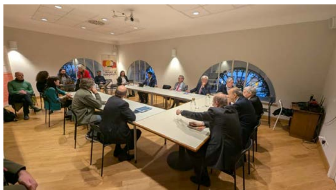
Incontro al think-thank del Cespi

Nel Convegno dedicato a Rabin (che ha visto una grande partecipazione), nel fitto programma di incontri - con la Farnesina , le Commissioni Esteri di Camera e Senato , il Sindaco di Roma , il think-thank Cespi , la Segretaria del PD - e nelle molte interviste concesse a quotidiani e televisioni , Beilin e El-Abed hanno illustrato la proposta di una Confederazione di Due Stati Sovrani che consenta, in un quadro di convivenza e di cooperazione, di dare soluzione alla duplice esigenza di garantire la esistenza sicura di Israele e soddisfare l'aspirazione palestinese ad un proprio Stato.