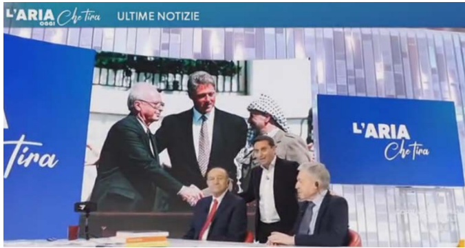
L'aria che tira - clicca qui o sull'immagine per vedere il video