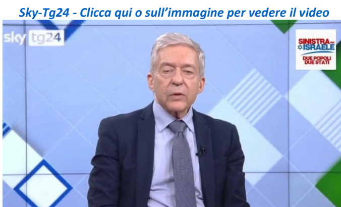
Sky-Tg24 - Clicca qui o sull'immagine per vedere il video