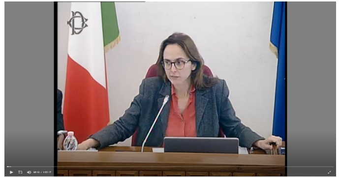
Comm. Esteri - clicca qui o sull'immagine per vedere il video

Una Confederazione tra Israele e Stato di Palestina , aperta anche alla eventuale partecipazione del Regno di Giordania , che realizzi forme di cooperazione e integrazione economica, sociale, culturale ispirandosi all'idea coltivata da Simon Peres che le frontiere non debbano essere muri che dividono, ma calamite che uniscono.