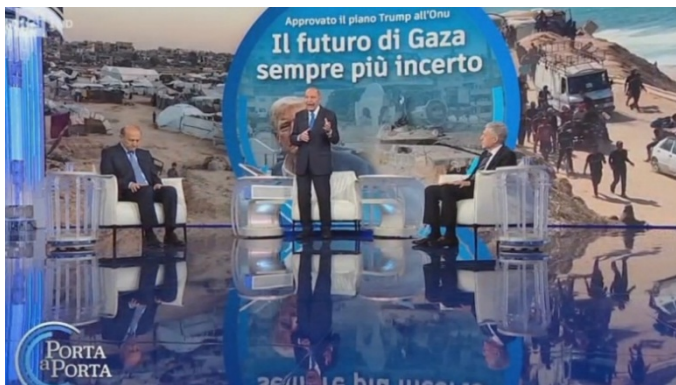
Porta a porta - Clicca qui o sull'immagine per vedere il video

La proposta che Yossi Beilin e Samieh El-Abed hanno avanzato - nella conferenza, negli incontri politici e sui media - è un utile riferimento per tutti coloro che si battono per una pace giusta e condivisa. Anche per noi di "Sinistra per Israele - Due Popoli Due Stati".